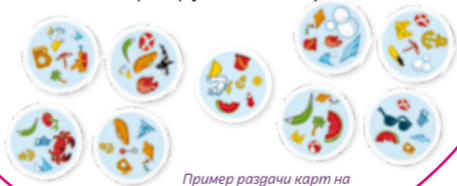
Пример раздачи карт на 2 детей.

2) Цель игры: Первым перевернуть все свои карты рубашкой вверх.